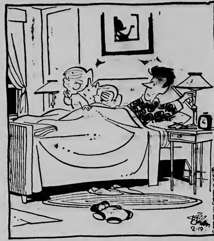
„Was dat alicen maar een donderslag?“